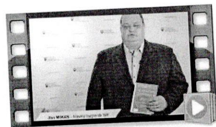
Odborníci o koronavírusu.mp4