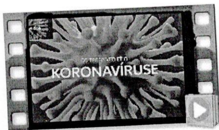
COVID-19 - praktické informácie.mov